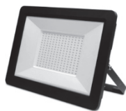
(C) 聚光燈(Spot Light)